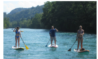
STAND UP PADDLING