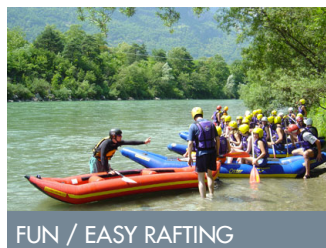
FUN / EASY RAFTING