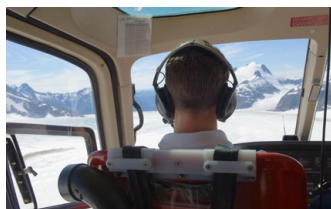
PILOTER UN HÉLIOPTEËRE