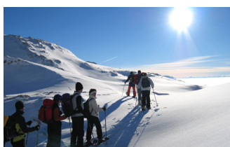
RANDONNÉE EN RAQUETTES