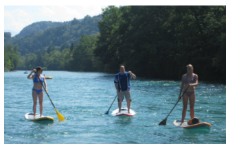
STAND UP PADDLING