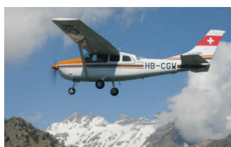
BAPTÊME DE L'AIR