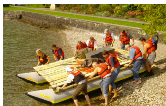
CONSTRUCTION DE RADEAU