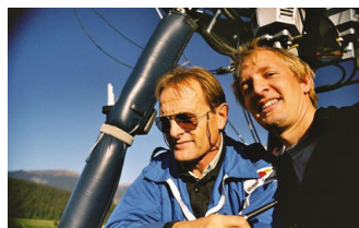
VOL EN BALLON