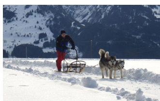
CHIENS DE TRAINEAUX