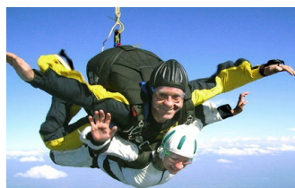
SAUT EN PARACHUTE