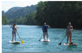
STAND UP PADDLING