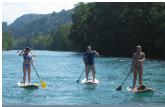
STAND UP PADDLING