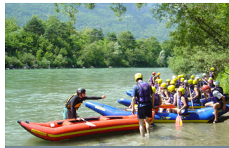
FUN / EASY RAFTING