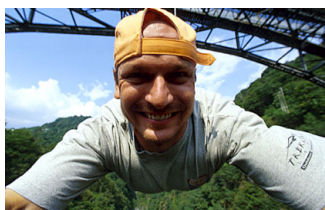
SAUT À L'ÉLASTIQUE