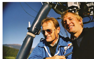
VOL EN BALLON