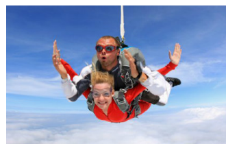
SAUT EN PARACHUTE