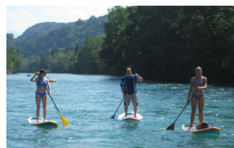
STAND UP PADDLING