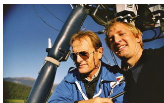
VOL EN BALLON