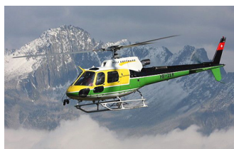
VOL EN HÉLICOPTÈRE