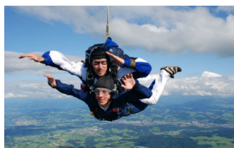
SAUT EN PARACHUTE