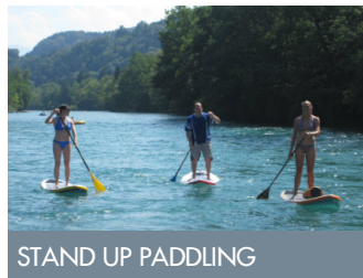
STAND UP PADDLING