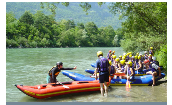
FUN RAFTING / EASY RAFTING