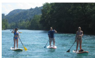
STAND UP PADDLING