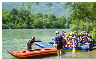
FUN RAFTING / EASY RAFTING