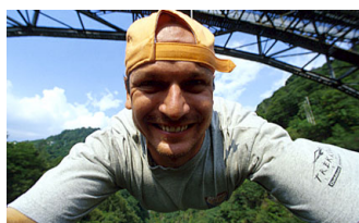
SAUT À L'ÉLASTIQUE