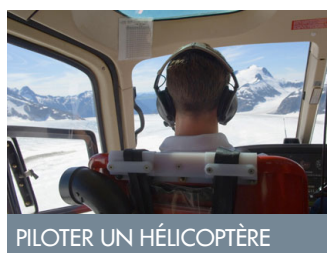
PILOTER UN HÉLICOPTÈRE