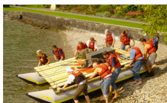
CONSTRUCTION DE RADEAU