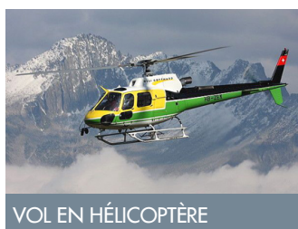
VOL EN HÉLICOPTÈRE