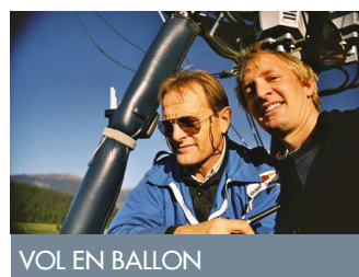
VOL EN BALLON