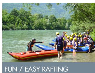
FUN / EASY RAFTING