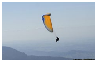
PASSAGIERFLUG und SCHULUNG