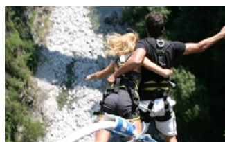
BUNGY VON EINER BRÜCKE